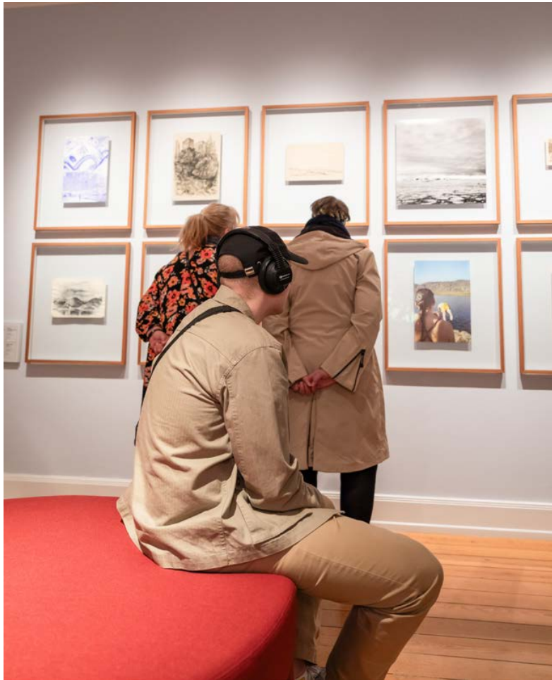
Saqqummersitami “Homeland”-imi Inuuteq Storchip Nunarput nunamit namminermit isigaa aamma sumingaanneersuunerup qanoq paasariaqarneranik paasinnineq annerulersillugu – nunagisamik kusassaalluni naalagaaffimmik nunallu isikkuanik kusassaanermit allaanerulluinnartumik.

Tamanna assinik immikkut sunnuteqartitsivoq, sumiiffimmuut aalajangersimasumut - Nunatsinnut